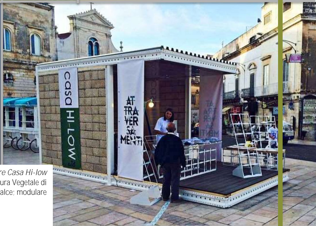
Sistema modulare Casa Hi-low Casa Passiva Mediterranea prefabbricata in Muratura Vegetale di Biomattone in Canapa e Calce; modulare