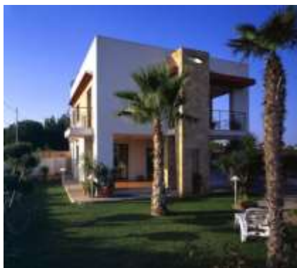
2003 Abitazione rurale Bisceglie Committente: Privato