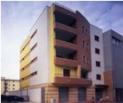
2000 Edificio residenziale e commerciale Bisceglie Committente: Privato