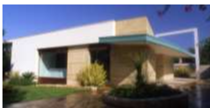
1997 Villa unifamiliare M Villa unifamiliare C Bisceglie Committente: Privato