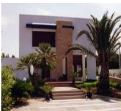
1995 Villa unifamiliare Bisceglie Committente: impresa costruzioni Geom. D. Pedone